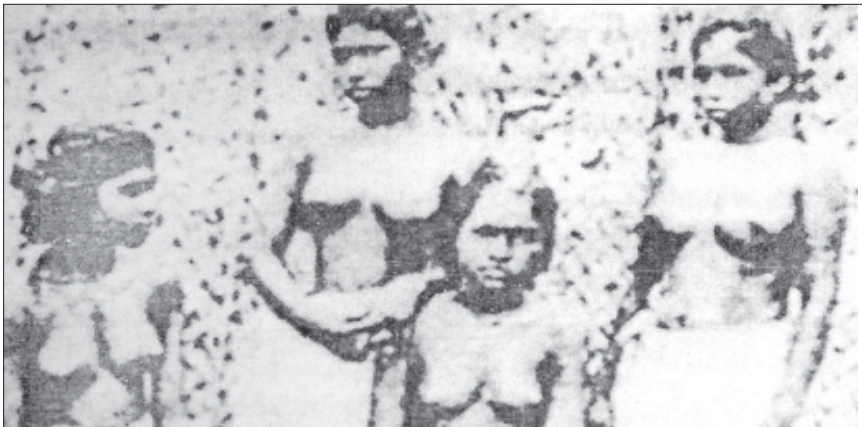
ങ്ങൾ ധരിക്കാനും വിലക്കുണ്ടായിരുന്നു.

ക്കാരായ ക്രിസ്ത്യൻ സ്ത്രീകൾ മേൽവസ്ത്രം ധരിക്കാൻ തുടങ്ങി. ഇവരെ പൊതു സ്ഥലത്തുവെച്ചും ചന്തകളിൽ വെച്ചും മേൽ ജാതിക്കാർ ഉപദ്രവിച്ചു. ശുഭ്രർ മുതൽ മുകളിലേക്കുള്ള ജാതിയിൽപ്പെട്ട സ്ത്രീകൾക്ക് മാത്രമേ മേൽ വസ്ത്രം ധരിക്കാൻ അനുവാദമുണ്ടായിരുന്നുള്ളൂ. എന്നാൽ മിക്ക ശുഭ്രസ്ത്രീകൾക്കും അത് അത്യുപശ്രമമായി തോന്നിയിരുന്നില്ല. നാടാർ, ഇഴുവർ, അടിമകൾ എന്നീ വിഭാഗത്തിൽപ്പെട്ട സ്ത്രീകൾക്ക് അരയ്ക്കുമുകളിൽ യാതൊരു വസ്ത്രവും ധരിക്കാൻ അനുവാദമില്ലായിരുന്നു. ഇവർക്ക് ആരേണ